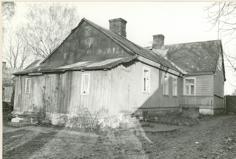
1. Widok z głębi podwórza