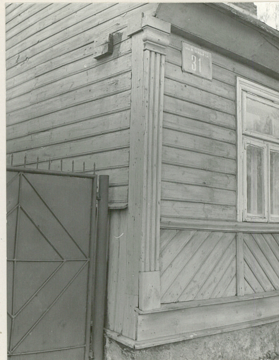
2. Narożnik płd-wsch