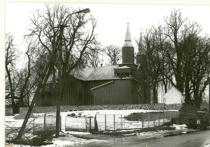
Widok od półn.