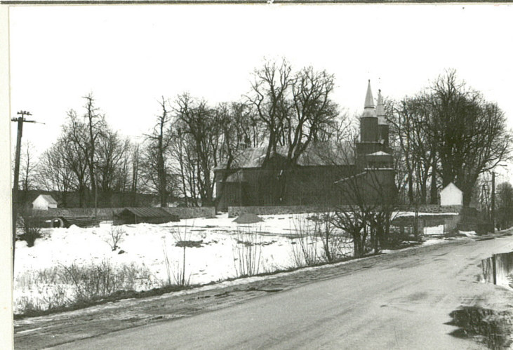
Widok od półn.