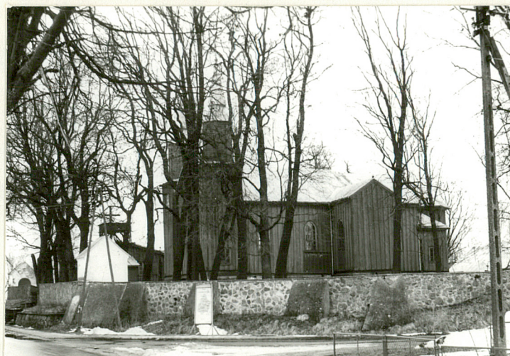
Widok od połd.