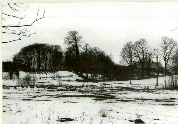
Widok od wsch.