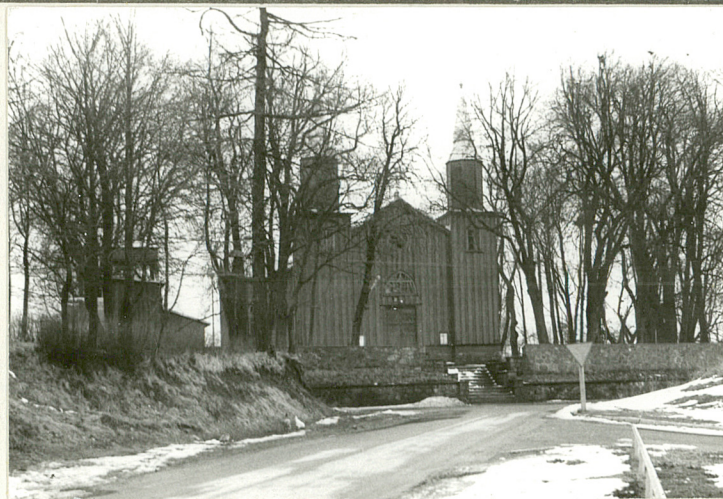
Widok od zach.