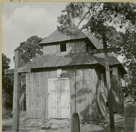
Widok od zach.