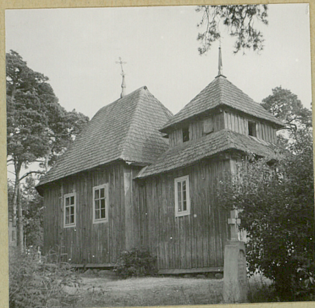
Widok od pn.-zach.