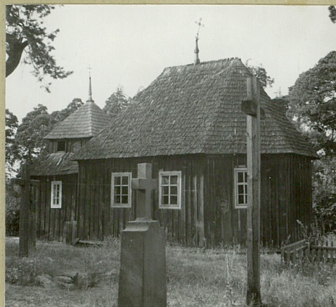
Widok od poł.