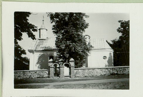
Trzcianka - Autenik