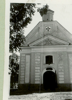
Troczewski - Antoniuk