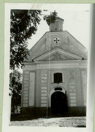
8047806 : 000156 Str. 71