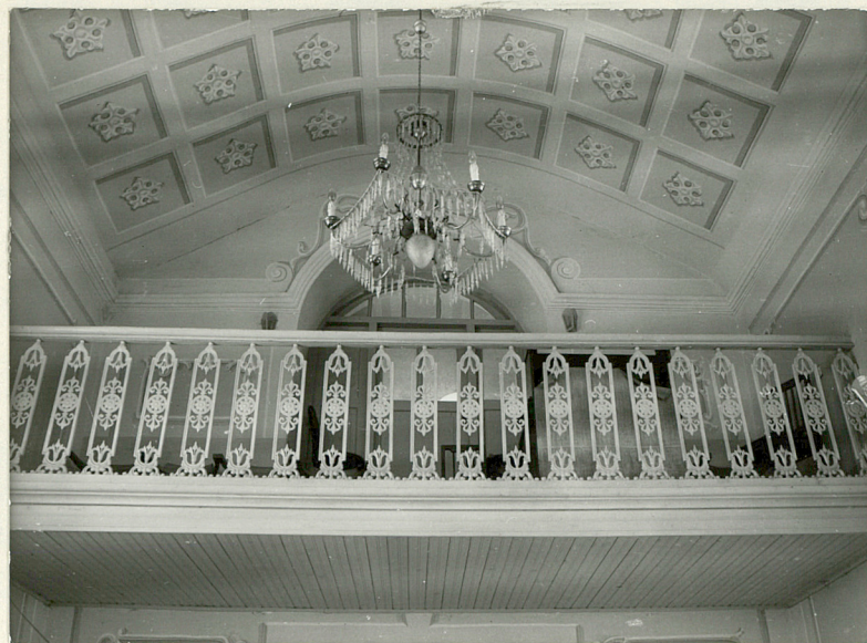
widok na chór muzyczny