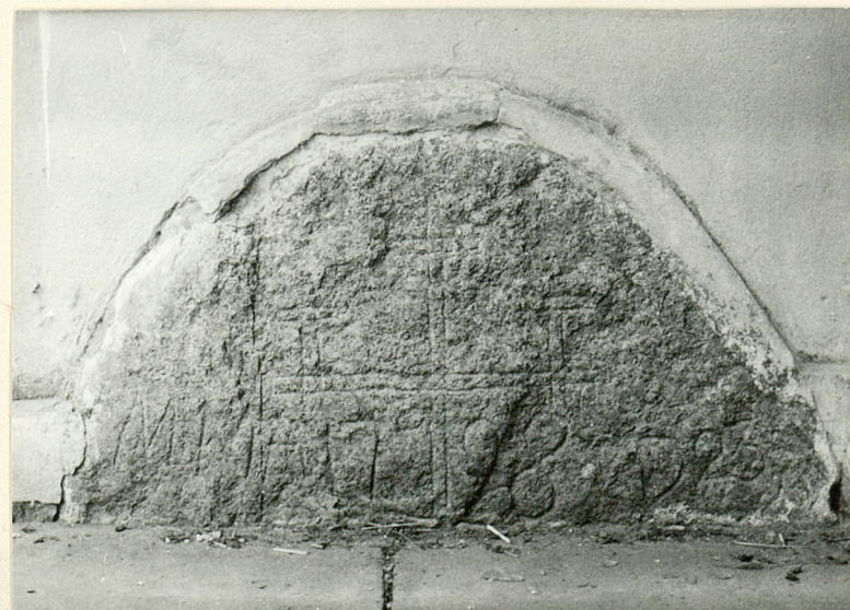
Kamień węgilny w przyziemiu prezbiterium z datą 1798