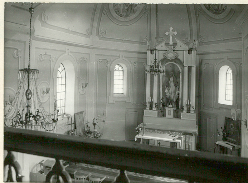
widok z chóru na prezbiterium