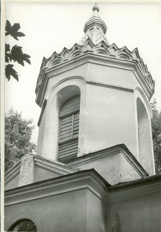
wieża-dzwonnica w partii frontowej