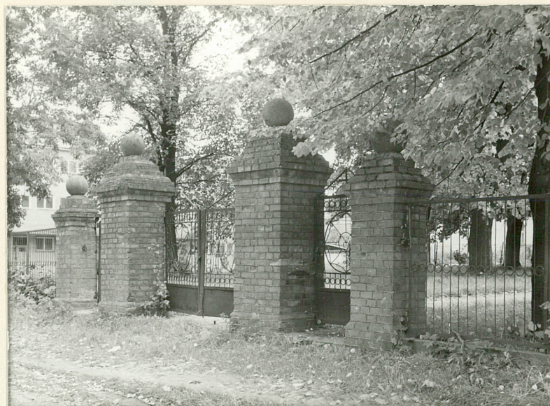
główna brama na osi cerkwi

Zał. W. Boruch, III. 86 neg. w BBiDZ Łomża