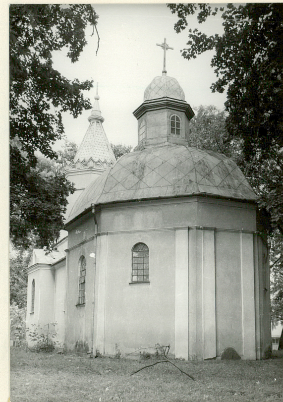
widok od str. prezbiterium