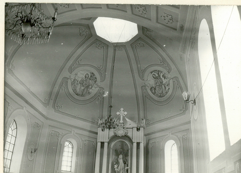
kopuła nad prezbiterium