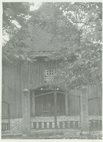
1. Fot. 1959.

Orientowany. Drewniany, konstrukcji zrębowej szalowany. Halowy. Na planie prostokąta z węższym prostokątnym prezbiterium od wsch. Z dwóch stron do prezbiterium przylegają zakrystie nad którymi łóże otwarte do prezbiterium. Prezbiterium przykryte drewnianym sklepieniem kolebkowym. Nawa główna sufitem. W zachodn. części nawy chór muzyczny na dwóch słupach. Dach dwuspadowy kryty gontem. Na kalenicy w pobliżu miejsca styku nawy z prezb. wieżyczka na sygnaturkę.