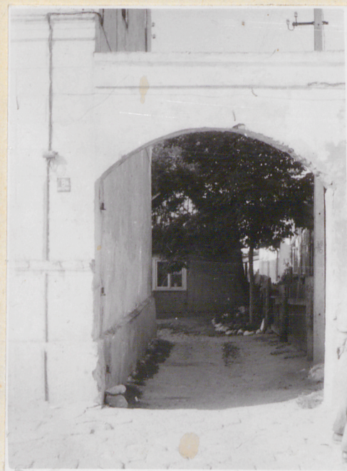
Ul. A.Czerwonej 8