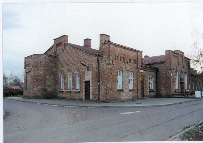
Fot. Widok ogólny z północy

11. Zdjęcia, rzut, przekrój, sytuacja, orientacja