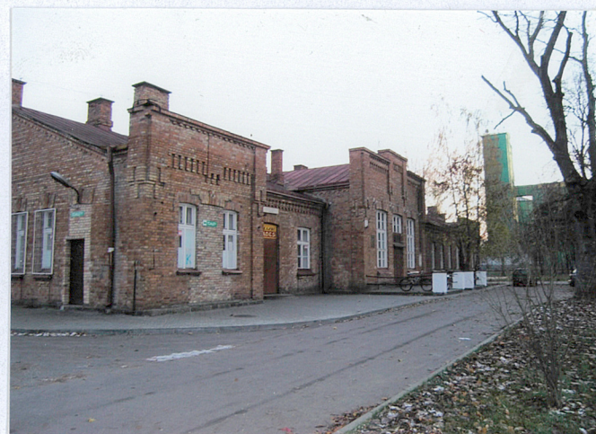
Fot. Widok ogólny z południowego zachodu