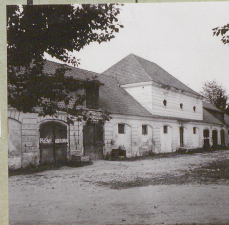
Fot. R. Bmkowski 1963