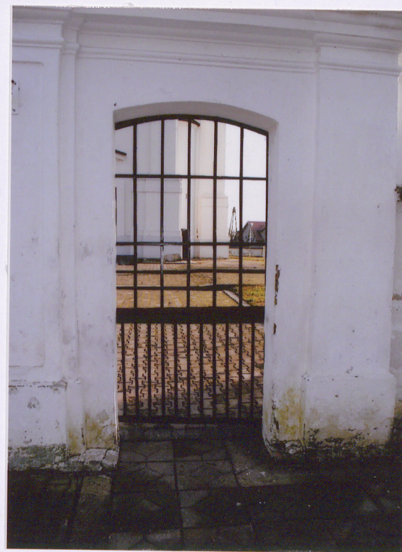
Furtka boczna widok od zach.