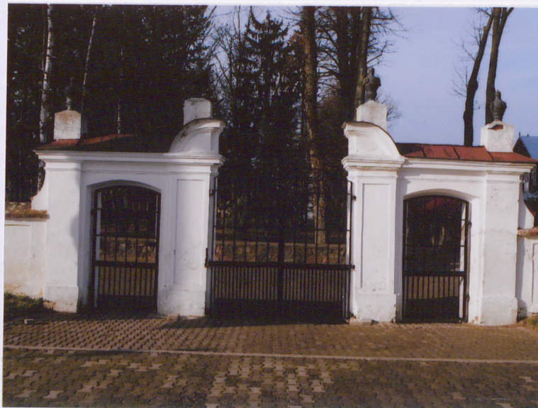
Widok ogólny od wsch.