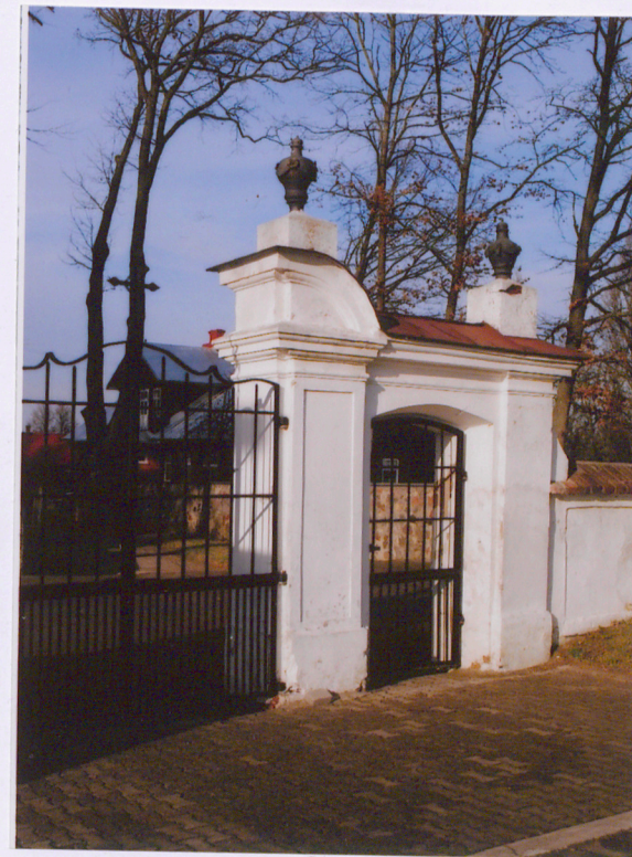
Furtka boczna widok od pd.-wsch.

Opracowanie załącznika: Iwona Górka, listopad 2016 (data i podpis)