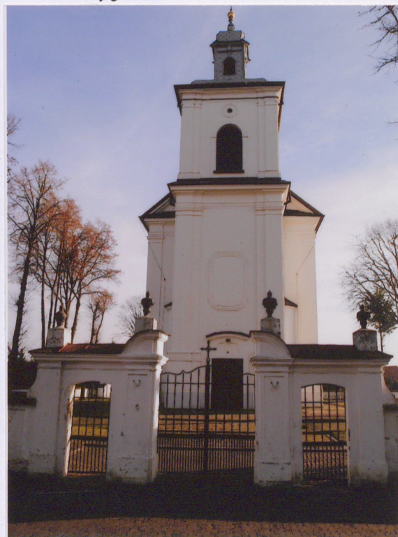
Widok ogólny od zach.