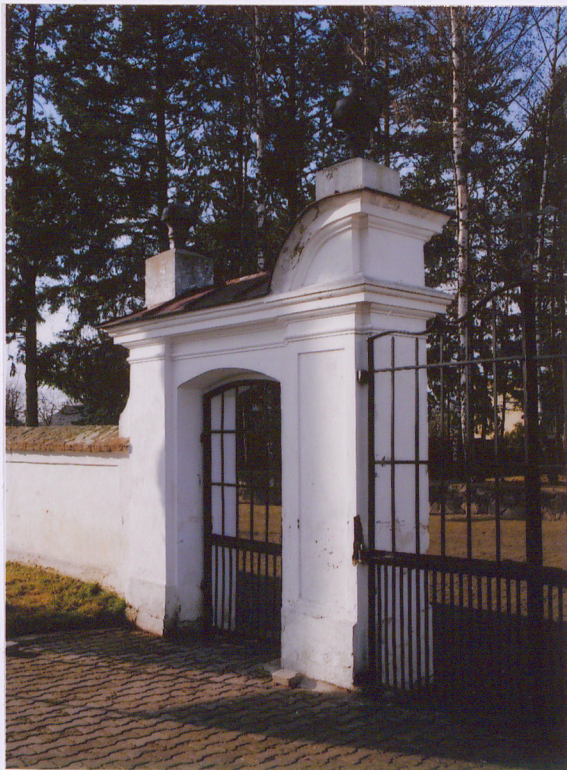
Furtka boczna widok od pn.-wsch.