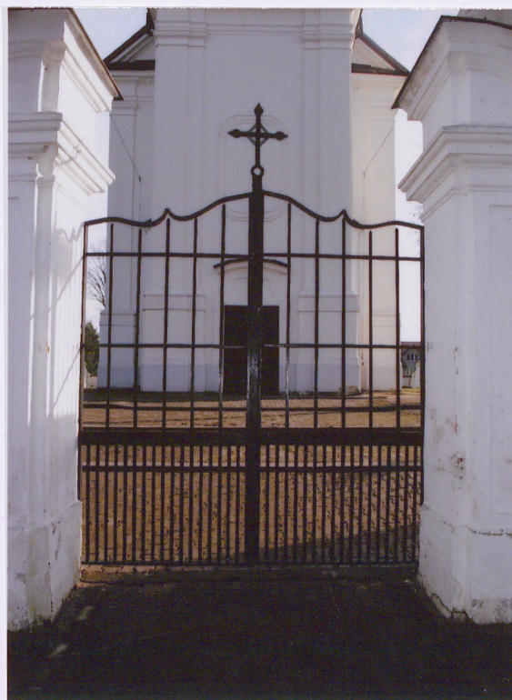
Przejazd widok od zach.