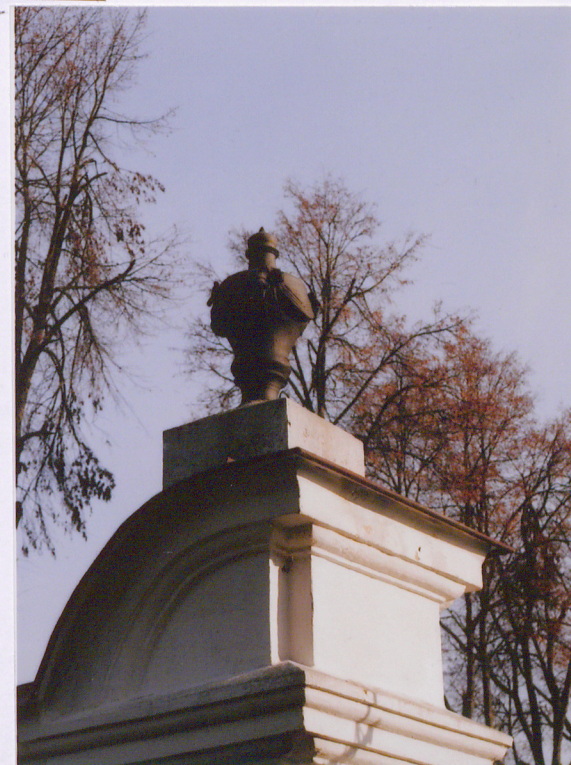
Waza wieńcząca filar