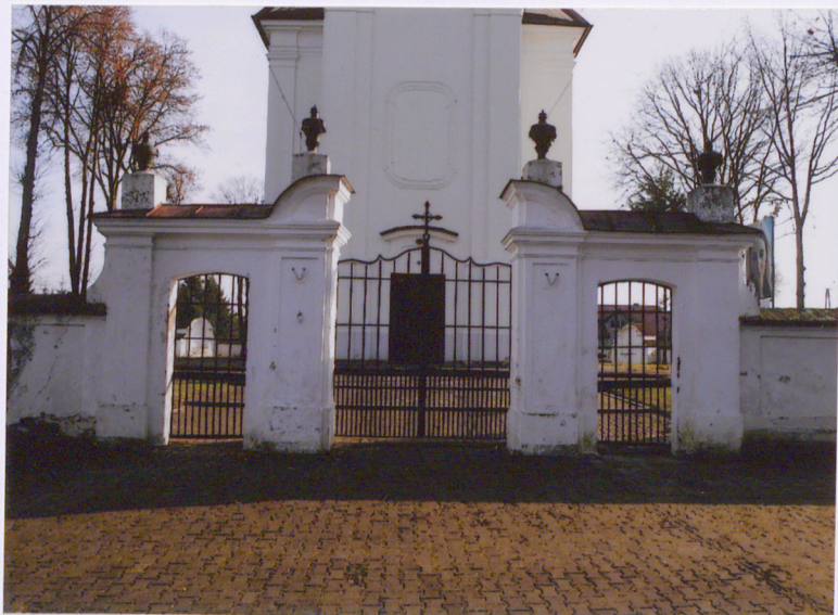
Widok ogólny od zach.

6. Zawartość załącznika: materiał fotograficzny