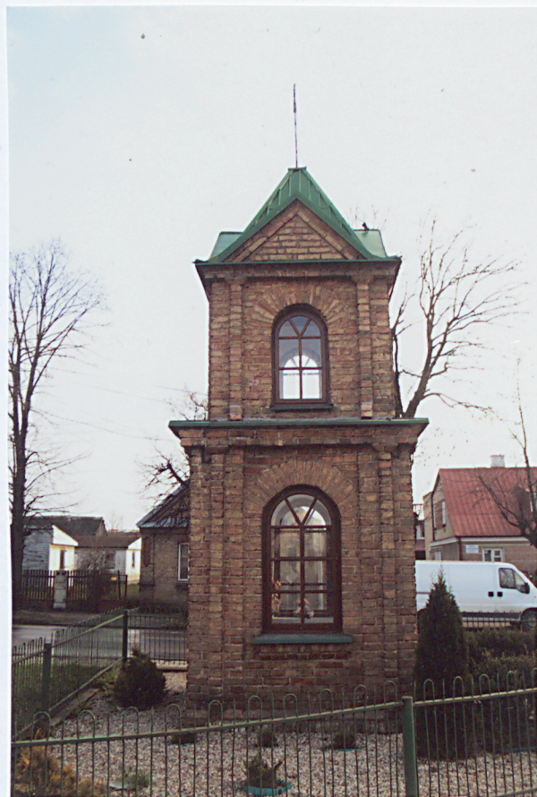
Fragment Elewacja północna