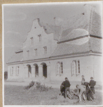
Zjednoczenie - zam. 1555, 18. 11. 37 - 12000 - kari.