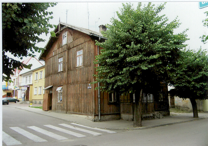
Fot. Widok od płd.-zach.

3. Zawartość wkładki (nazwa obiektu lub materiału uzupełniającego) 3 fotografie