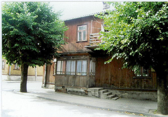
Fot. Widok od płd.-wsch.