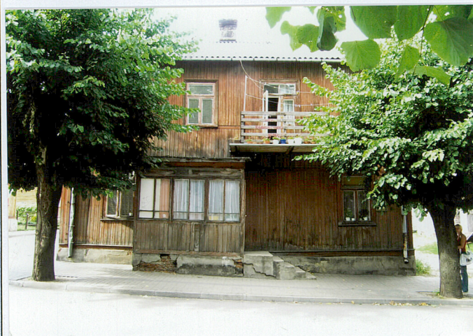
Fot. Elewacja południowa od ulicy Zaszkolnej

Wkładkę założył: Barbara Tomecka październik 2005r. (imię, nazwisko, data)