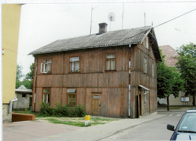
Fot. Widok ogólny od północnego zachodu

11. Zdjęcia, rzut, przekrój, sytuacja, orientacja