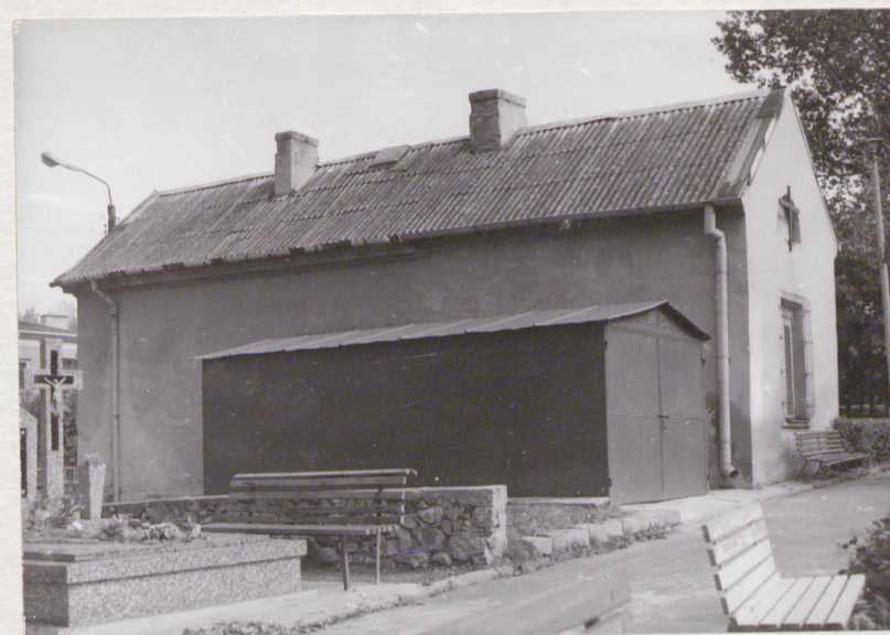
widok od str. zach.