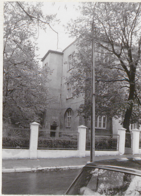
widok od str. pd.-zach.