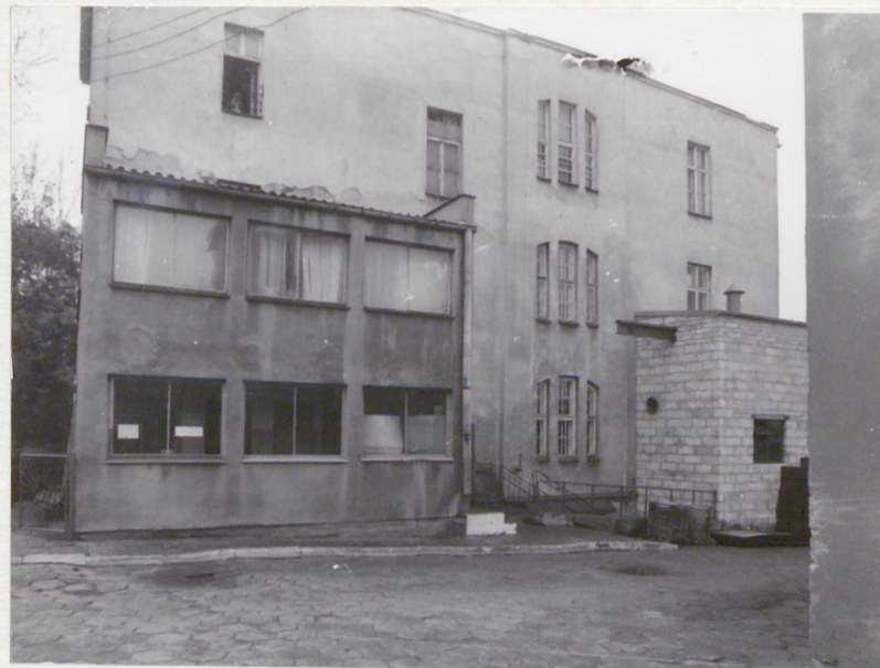
widok od str. wsch.