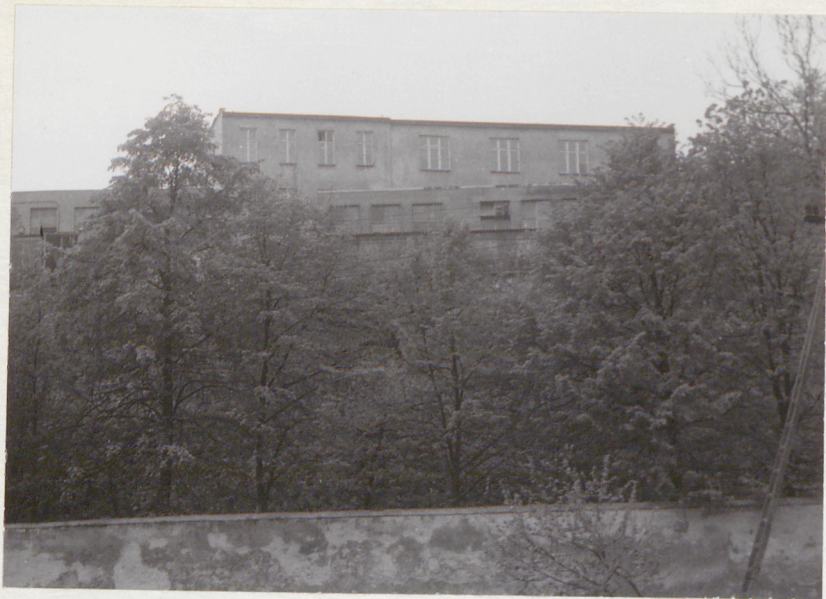
widok od str. pn.