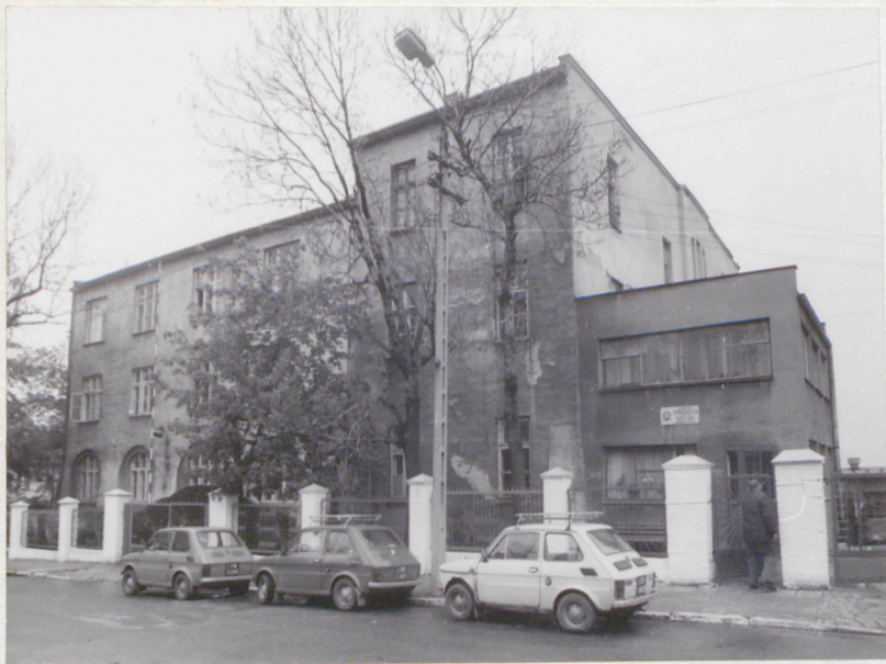
widok ogólny od str. pd.-zach.