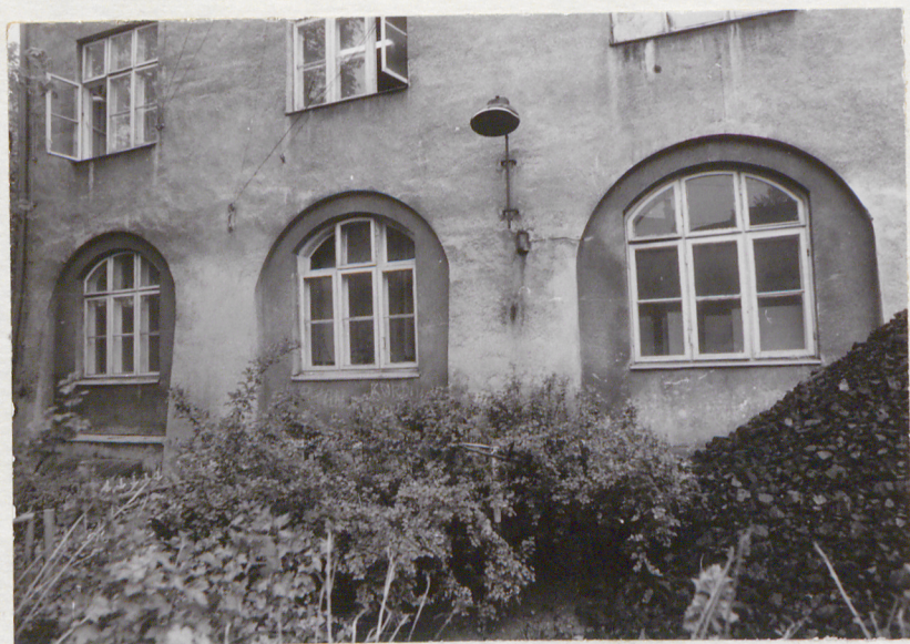
fragment elewacji frontowej /pd./