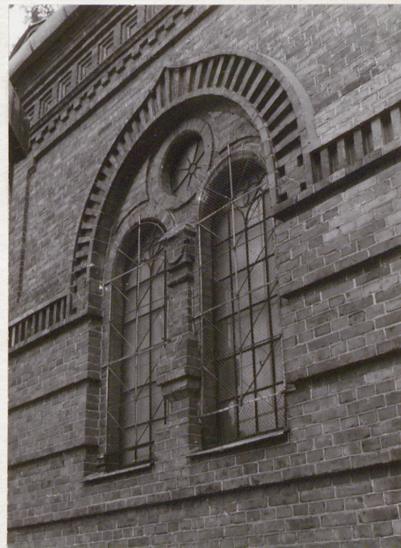
ozdobne obramienie okna w elewacji pd.