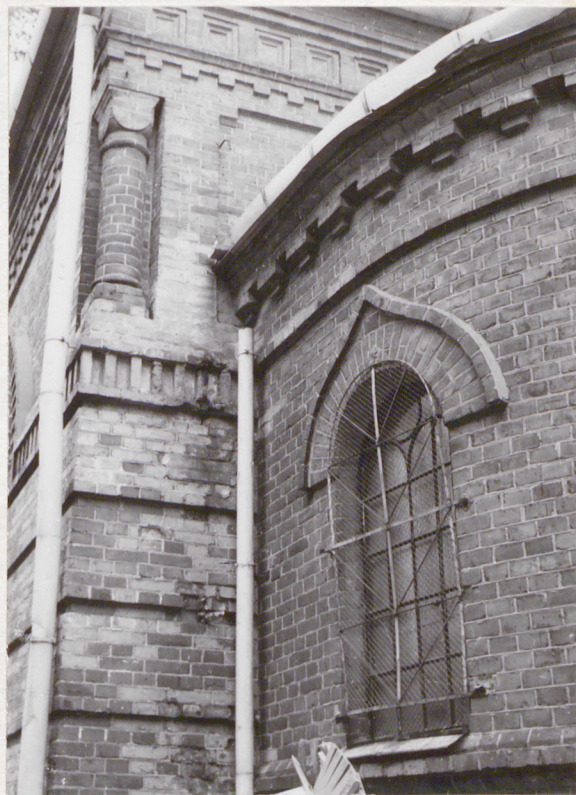
fragment nawy i prezbiterium