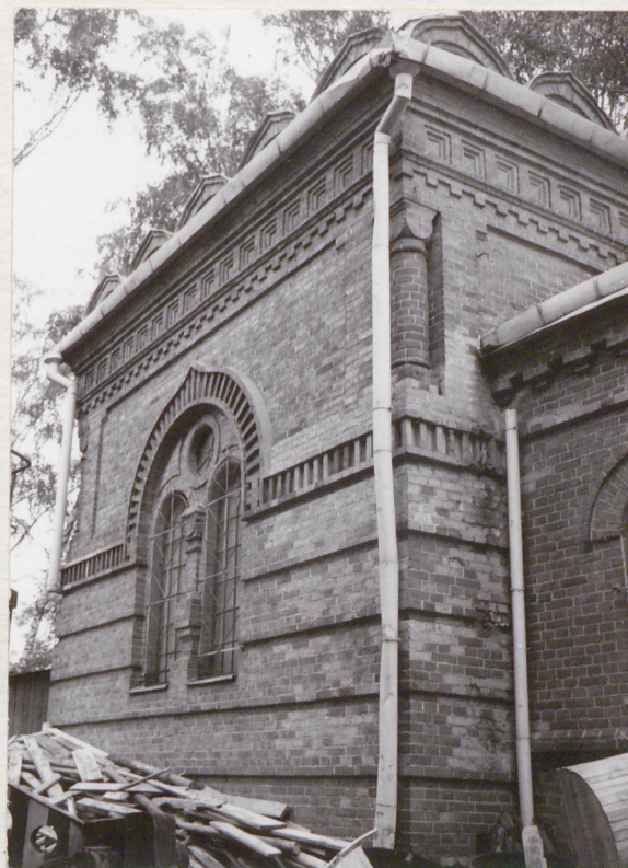
fragment elewacji od str pn.