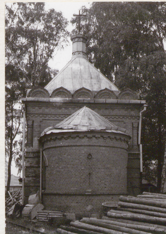
widok na prezbiterium