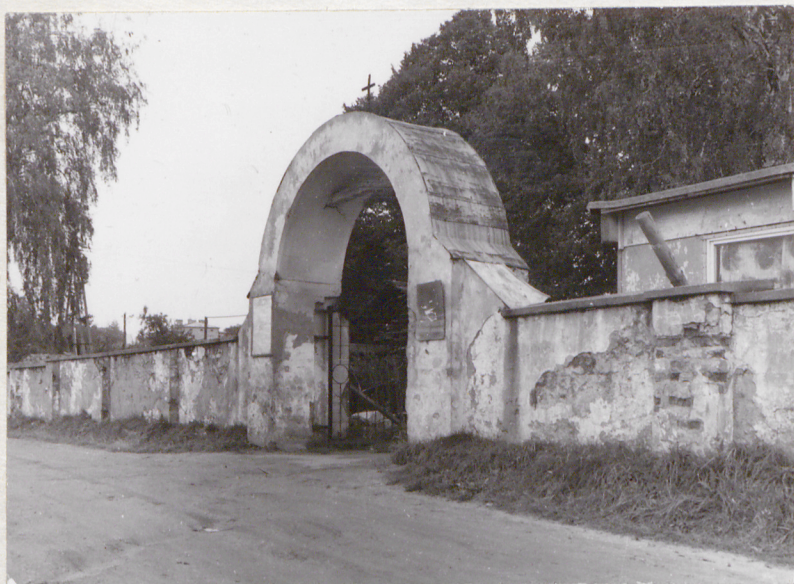
brama i ogrodzenie dawnego cmentarza wojskowego