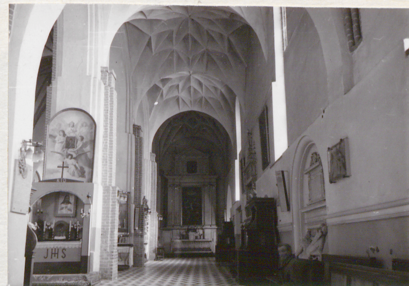
nawa boczna pd.