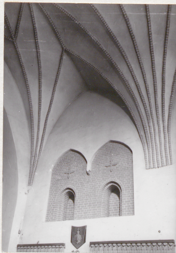
sklepienie nawy gł.