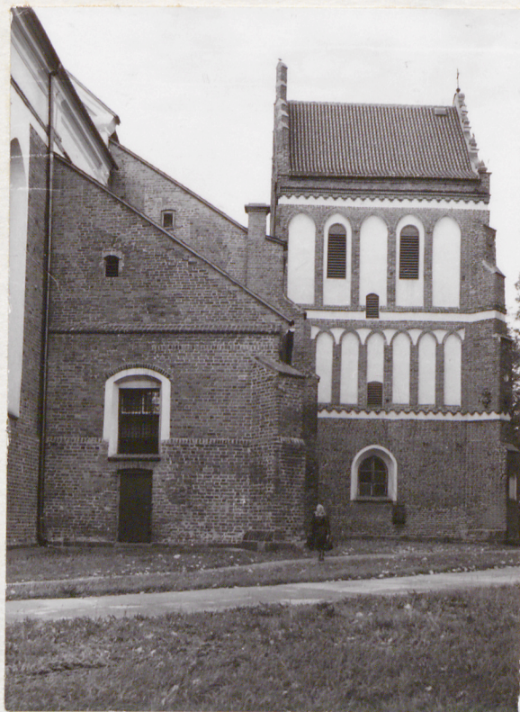
zakrystia i wieża od pn.