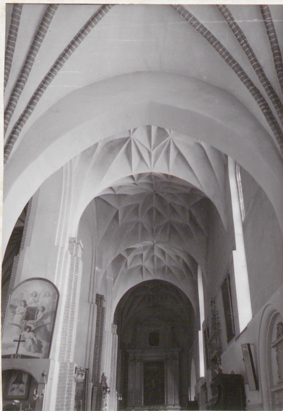
sklepienie nawy bocznej pd.