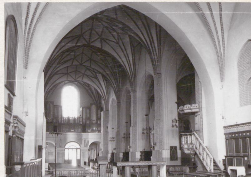
widok na chór muzyczny