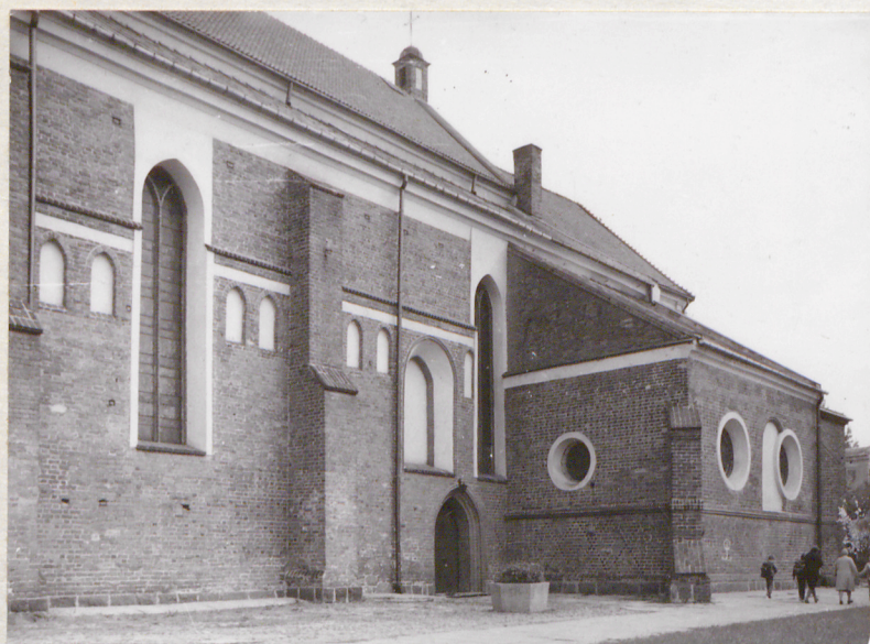
- fragm. elewacji pd.