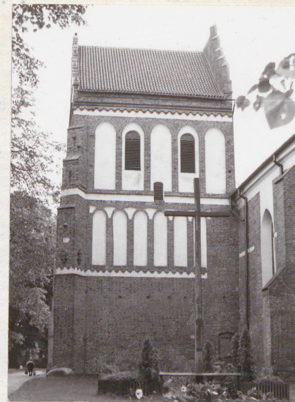
wieża od str.pn.