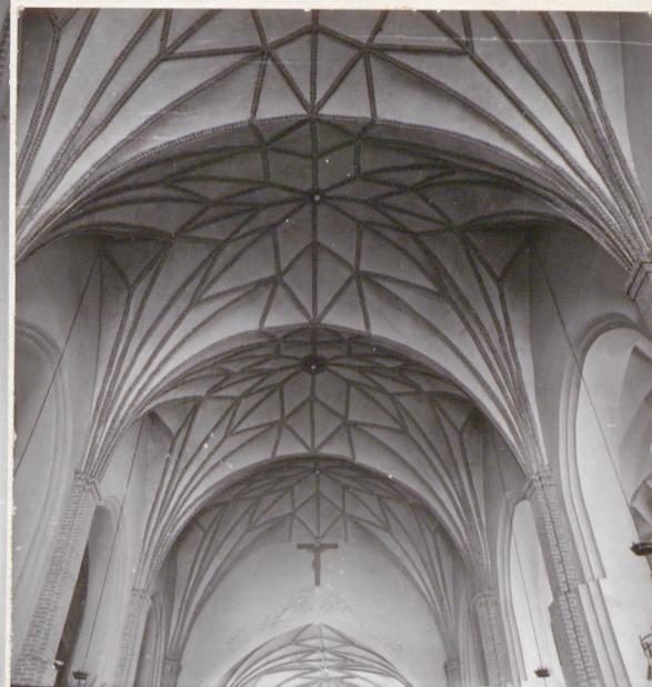
fragm. sklepienia prezbiterium