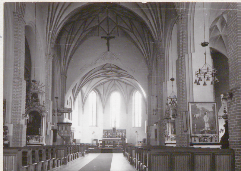
widok w kierunku prezbiterium