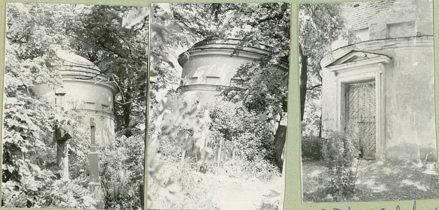
1. Fot. W. Golicki 1964 2. Fot. W. Golicki 1964 3. Fot. W. Golicki 1964

OPIS. h=6.00 Klasycystyczny. Murovana z cegły, tynkowana. Na planie koła. Ściany wewnętrzne rotundowane alternujące minami - kolumnami, grzys oddzielne kopuły z płytami kasetonami, w kopule otwór okrągły - świetlik. W elewacji zewnętrznej oświetlenie prowadzone przez grzys praski / atryk nad którą wieńce prostokątne płycin. Portal wejściowy od zachodu zaakcentowany szczytem trójkątnym na konsolach. Kopia kryta blachą.