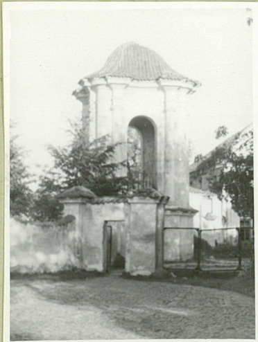
Fot. 1. 1959.

OPIS. Barokowa. Wzniesiona w mur cmentarny. Murowana z cegły Azykowane. Dwie kondygnacje. Na planie kwadratu z zaokrąglonymi narożnikami. Przy narożnikach występują kolumny na cokółkach wysokości dolnej kondygnacji. W górnej elewacji w każdej ścianie otwór w kształcie wydłużonego prostokąta zaciemnionego żaluzjami pełnymi. Ścisły plan elewacji na osiach wzniesienia. Dach kopulasty kryty dachówką ceramiczną.