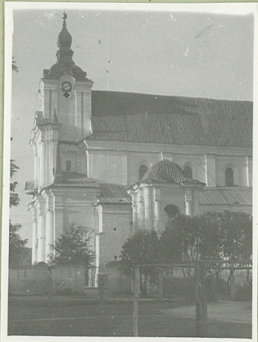
2. Fot. 1959