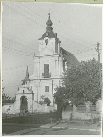
1. Fot. 1959

Dachy - nad nawą główną dwuspadowy. Kryty dachówką. Świątelnia, nad nawą boczną pulpitowe kryte blachą.