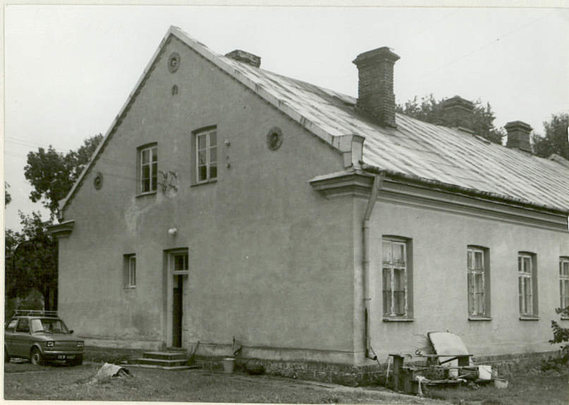
widok od str. zach.