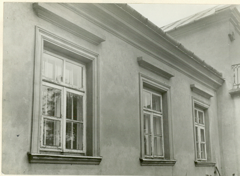
fragment ściany frontowej