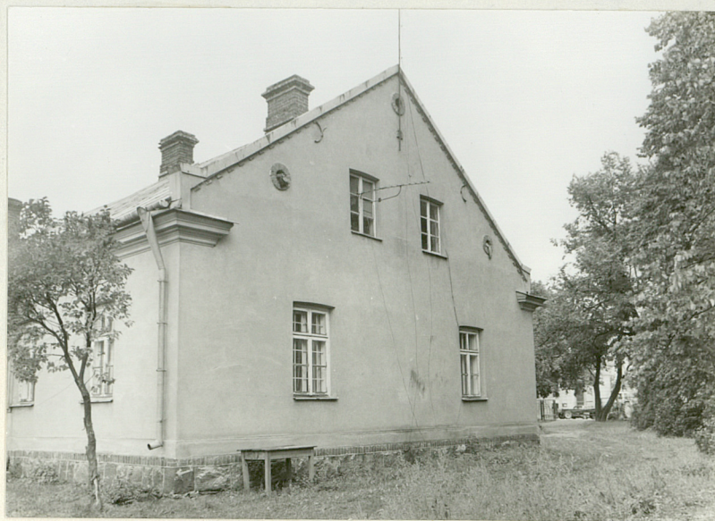
pd. ściana szczytowa