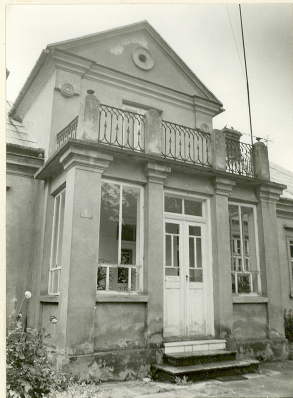
ganek od frontu