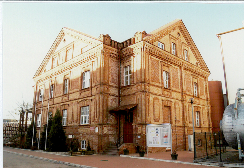
Elewacja południowa i wschodnia