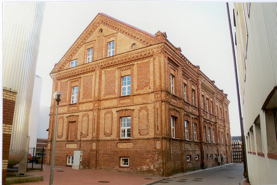
Elewacja północna i zachodnia

11. Zdjęcia, rzut, przekrój, sytuacja, orientacja