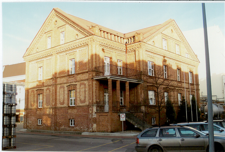
Elewacja południowa i zachodnia