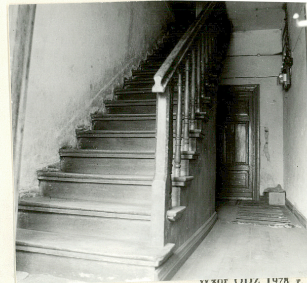
WZOR ODZ 1978 r.