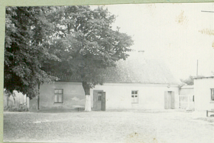
1. 1964