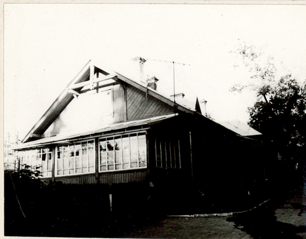
autor zdjęć data wykonania miejsce przechowywania negatywów neg.PP PKZ 19/15 IX 1979 r.