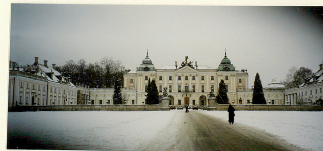
Wzór ODZ 1985

Jedn. W.A. Olsztyn z. 794/S/ON Z.P. Ostróda z. 662 n. 6000