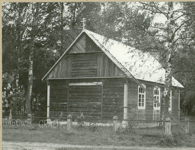
Widok od płd-wsch