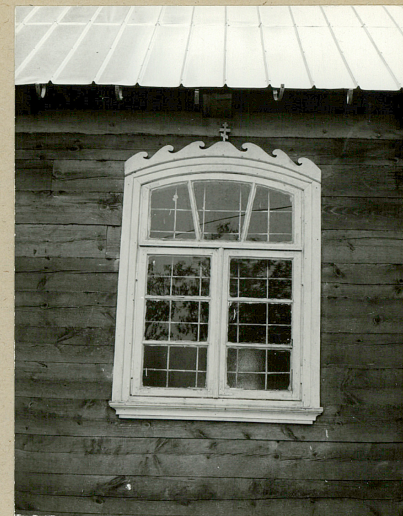
Okno w elewacji płn.