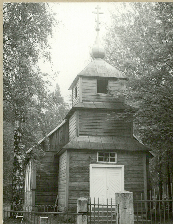
Widok od zach