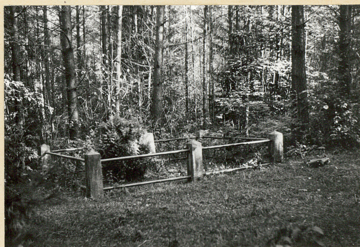
Widok ogólny mogiły