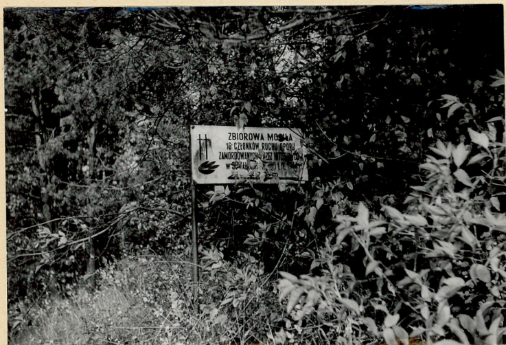
Tablica inform.(przy szosie)