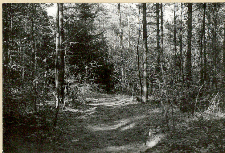
Dróżka prowadząca do mogiły