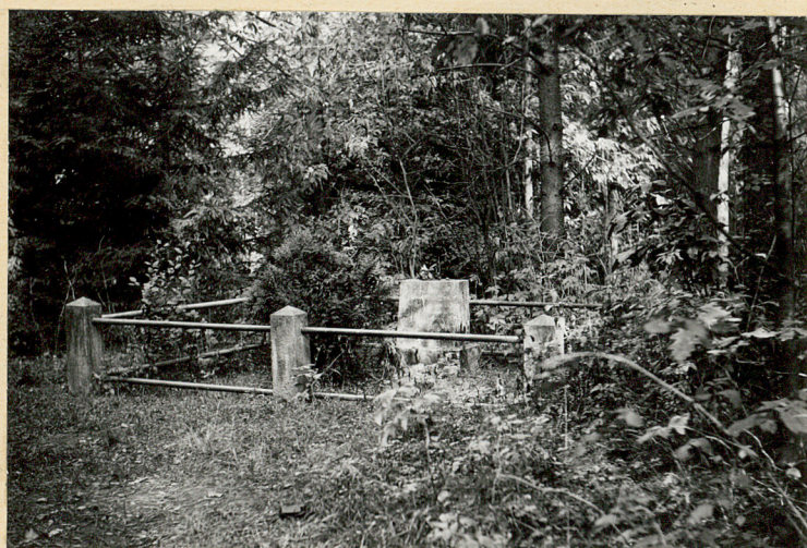
Widok ogólny mogiły