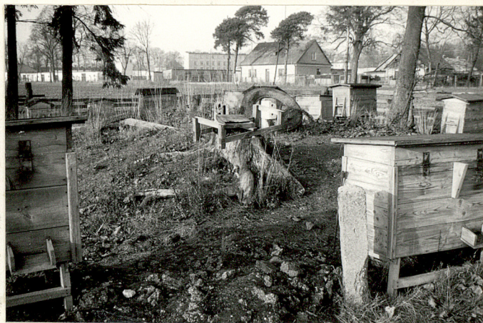
Fragm. wnętrza cmentarza