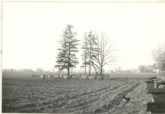
Widok od strony wschodniej