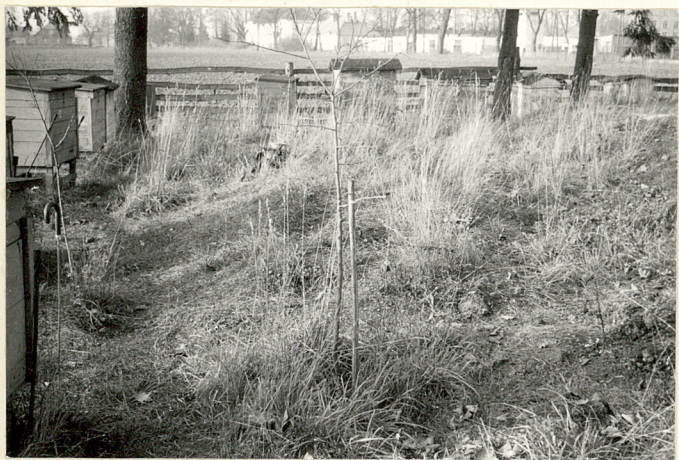
Fragm. wnętrza cmentarza