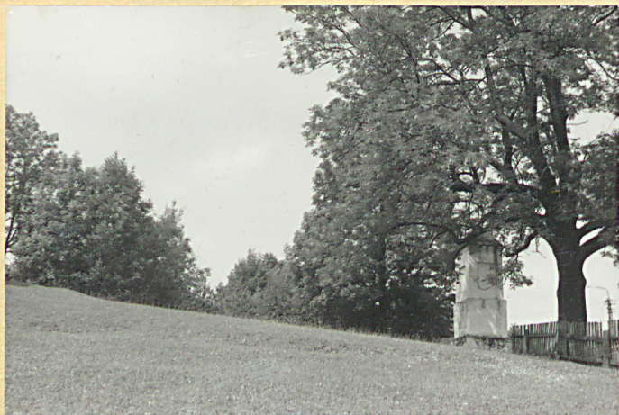
FOT. NR 1