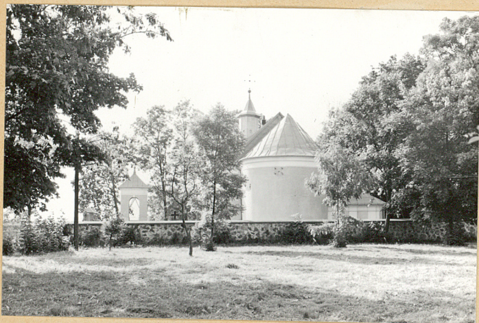
FOT. NR 1