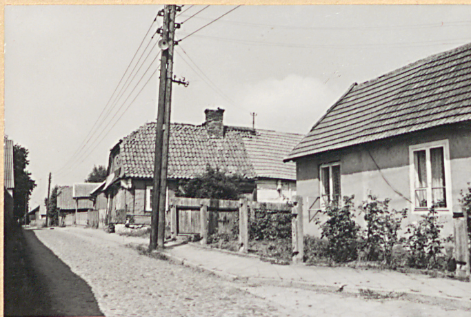
FOT. NR 1