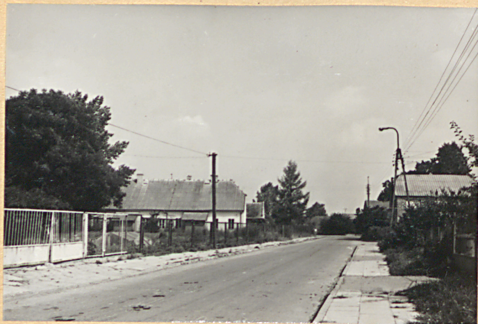
FOT. NR 1