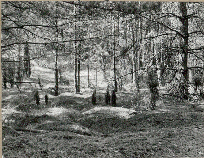
WIDOK OGÓLNY CMENTARZA OD STRONY PN - ZACH.