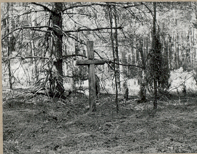
MOGIŁA Z DREWNIANYM KRZYŻEM