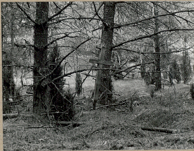
MOGIŁA Z DREWNIANYM KRZYŻEM