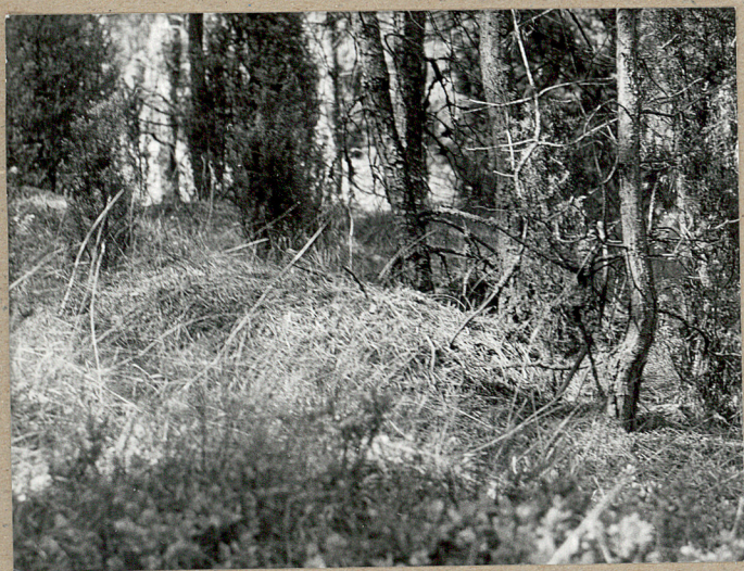
WIDOK NA MOGIŁĘ