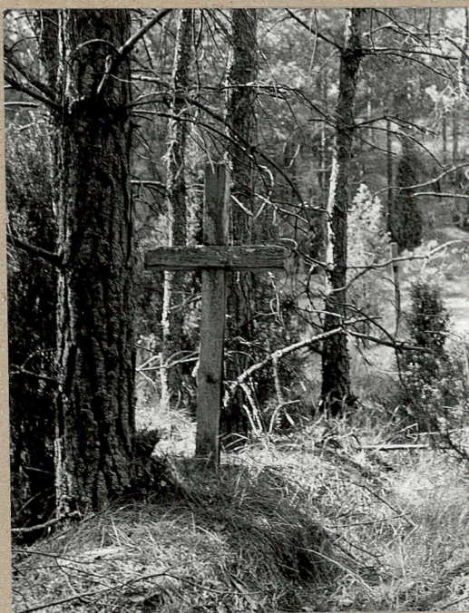
MOGIŁA Z DREWNIANYM KRZYŻEM