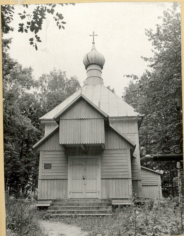
Cerkiew cmentarna p.w. św. Cyryla i Metodego