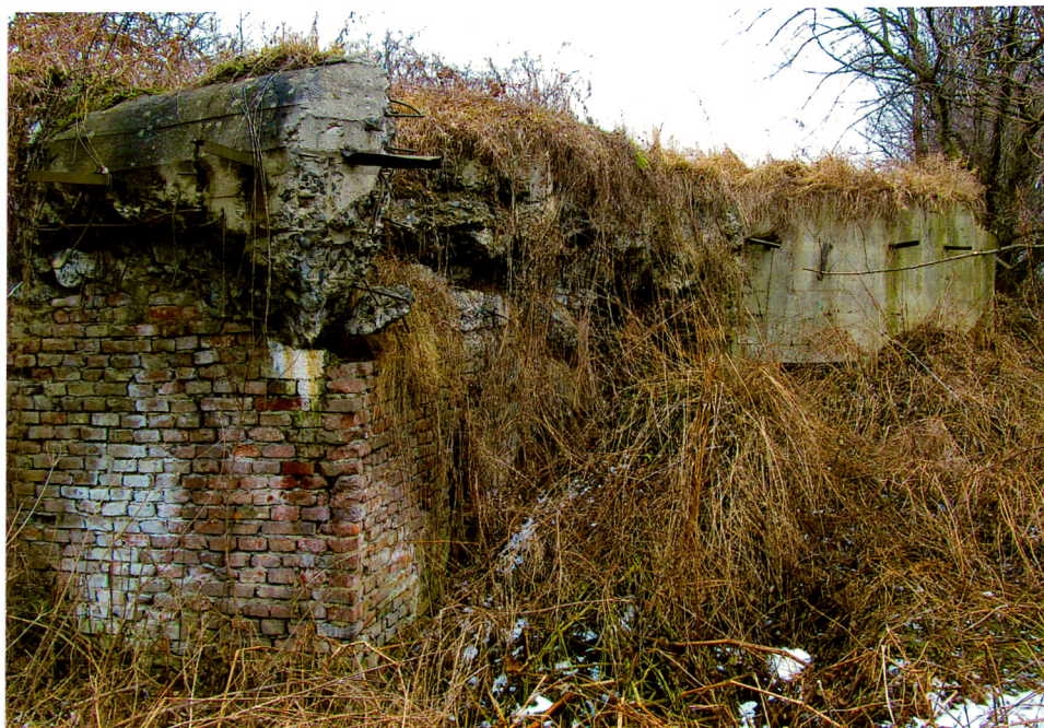
Widok od strony południowo-wschodniej