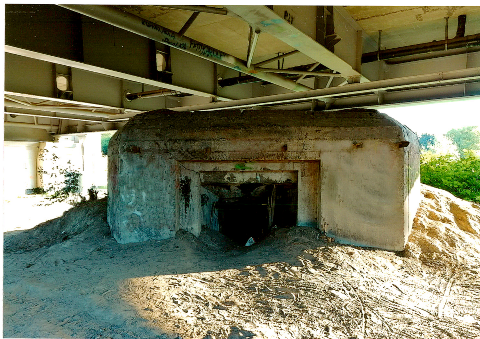
Widok od strony północnej