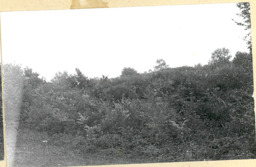
1. - 2.