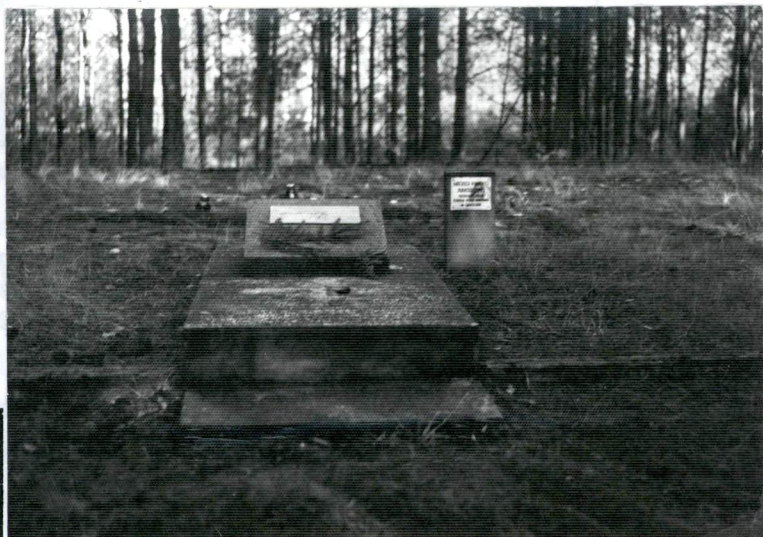
2. WIDOK PŁYTY UPAMIĘTNIAJĄCEJ ŚMIERĆ ŻYDÓW