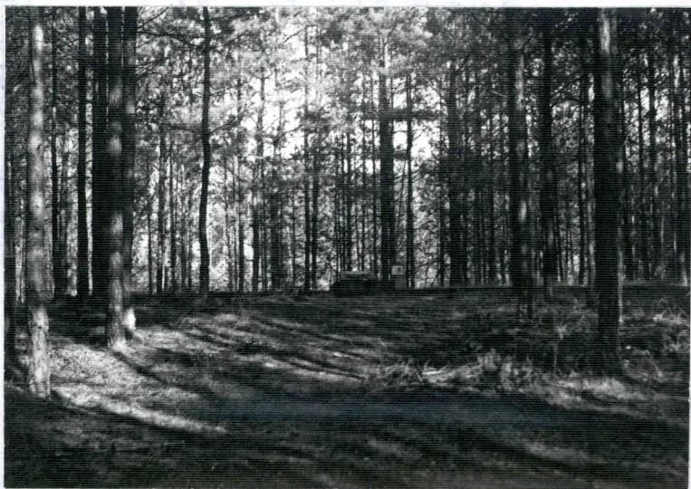
1. WIDOK OGÓLNY MOGIŁY W KIERUNKU PN. - WSCH.