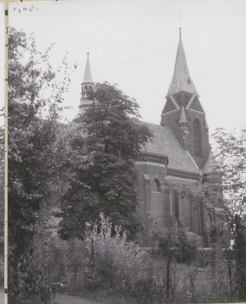
zeczucie 34. Inspekcje