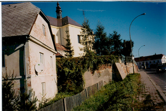
widok od strony południowej