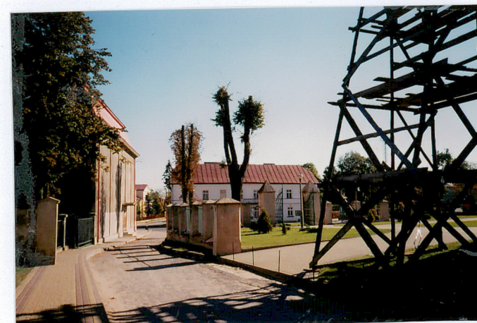
wjazd i ogrodoenie

POŁUDNIOWO-WSCHODNI INSTYTUT NAUKOWY Grodzka 3 37-700 PRZEMYŚL (0-16) 678-73-33 fax (0-16) 678-64-95