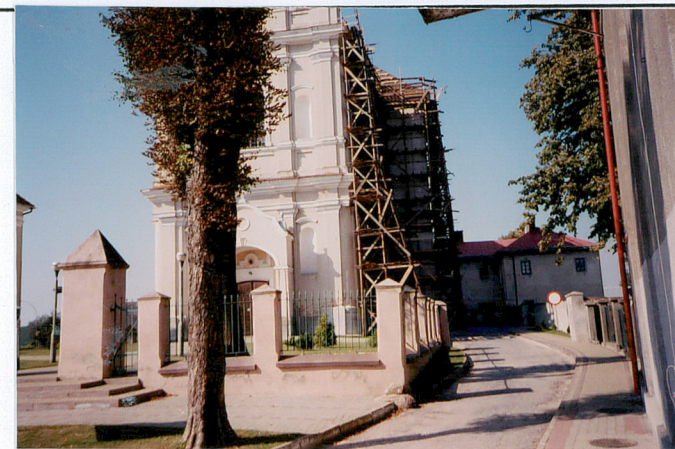
widok od strony wschodniej

Wkładkę założył: październik 2004 r. Ryszard Łamasz