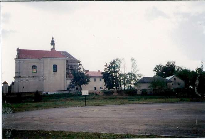
widok od strony północnej