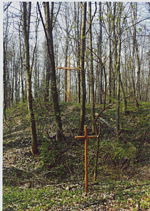
Wał szyjowy – miejsce straceń