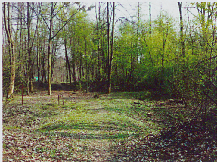
Widok na basteję