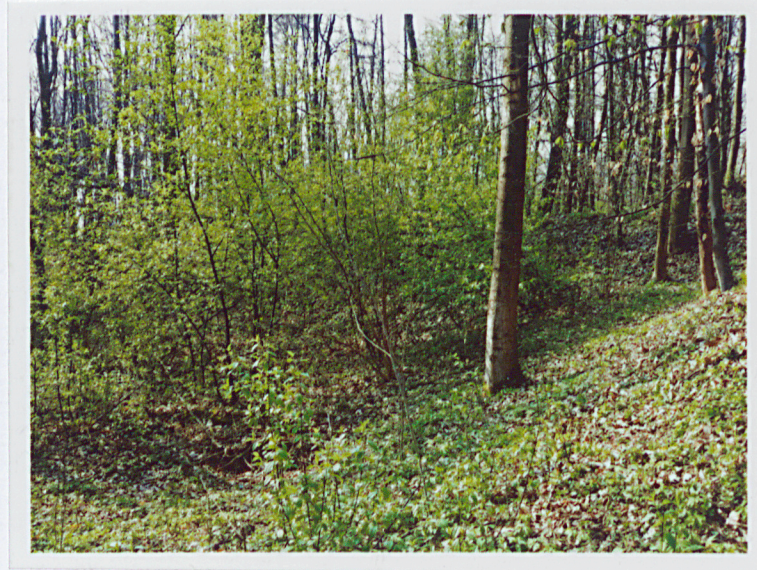
Miejsce po koszarach szyjowych