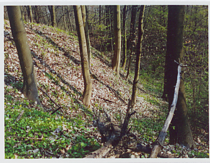
Stok lewego barku