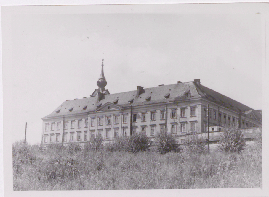
VI. 1951 r.

Wkładkę założył: 15.07.2008 r. (imię, nazwisko, data)