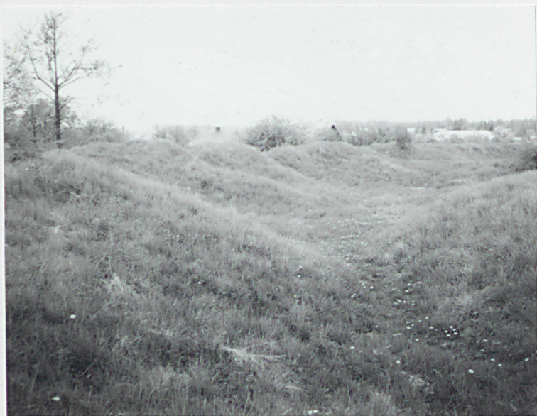
Wał artyleryjski. Widok od południa