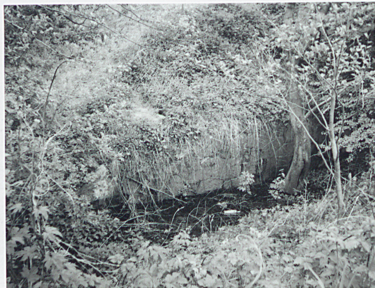
Kamienny mur oporowy lewego barku