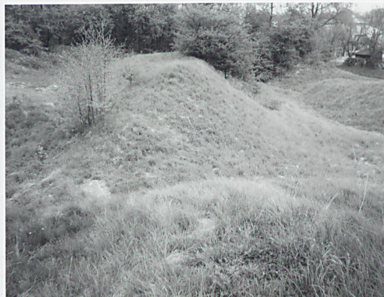
Nasyp ziemny nie- istniejących koszar szyjowych

Wkładkę założył: mgr K. Szuwarowski, 10.1998r. K. Szuwarowski