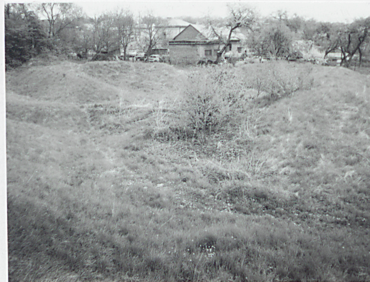
Szyjowy odcinek wału z wewn. kaponierą