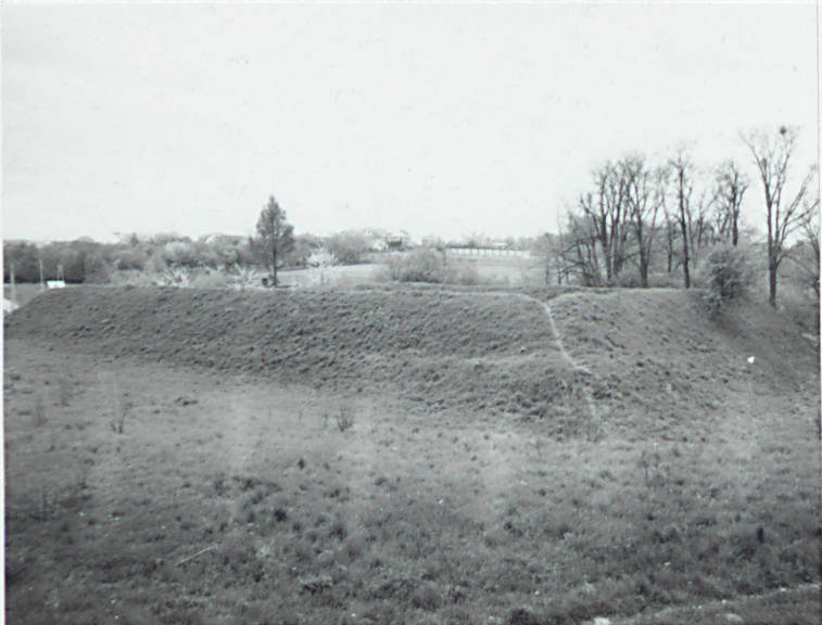
Widok ogólny wałów prochowni od strony wschodniej