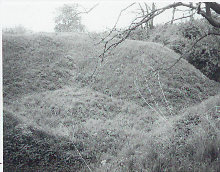
Wnętrze mniejszego południowego segm.