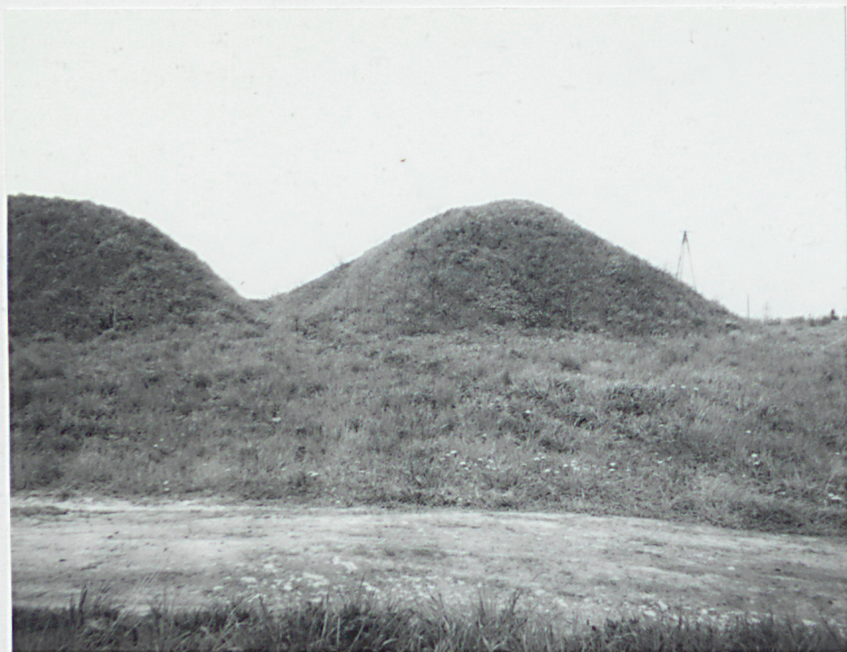
Wejście do północnego zespołu