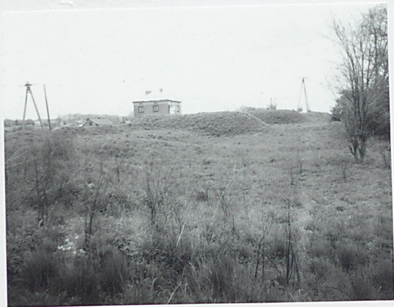
Widok poprzecznic jednego z ramion kleszczy wału rdzenia