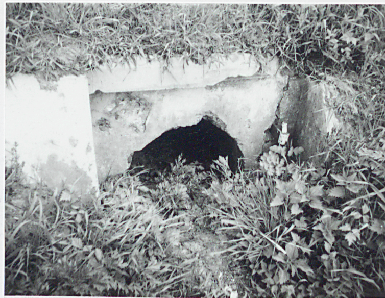
Wylot kanału odwadniającego południowy segment