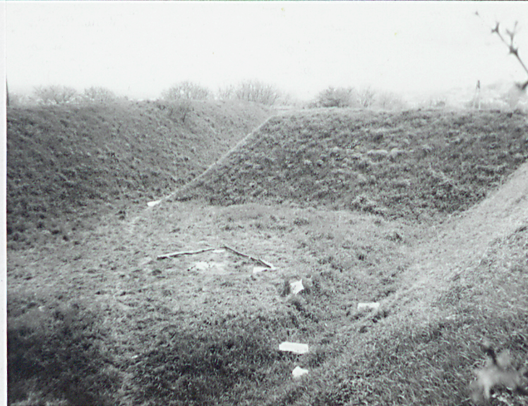
Wnętrze północnego, największego segmentu