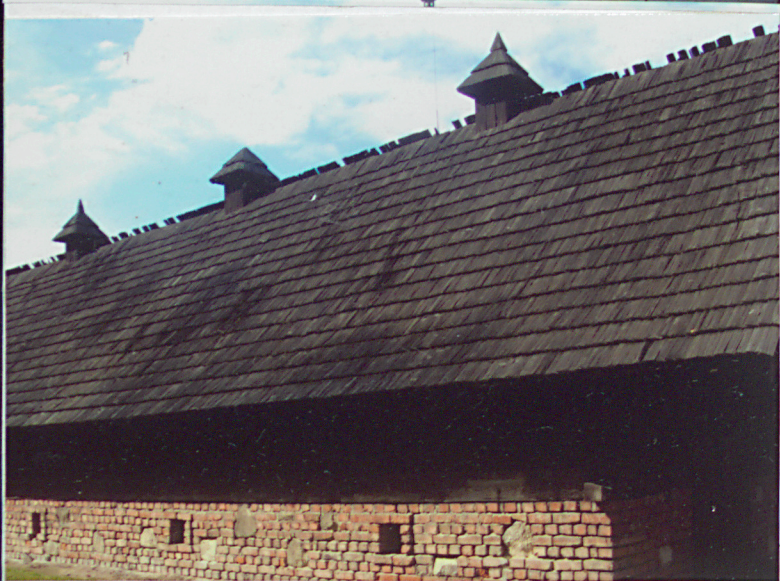
elewacja boczna północna i boczna wschodnia