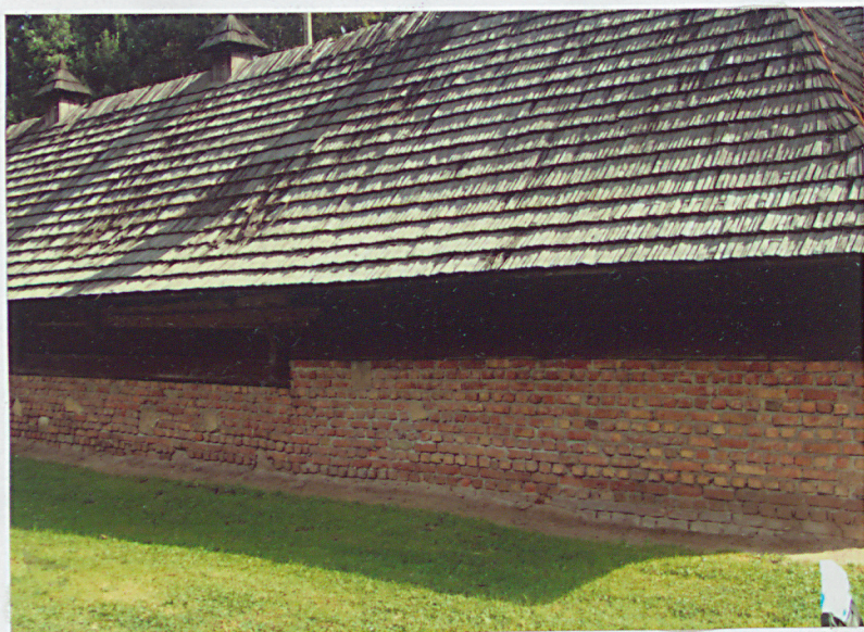
eleweja bozna zachodnia