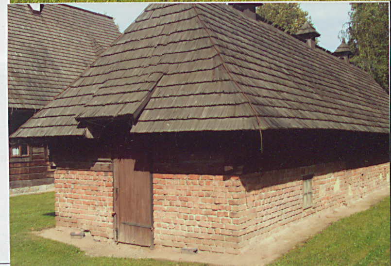
Opracowanie załącznika. (data i podpis)