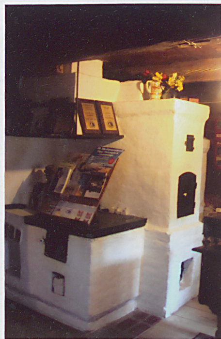
7. kuchnia z piecem chlebowym