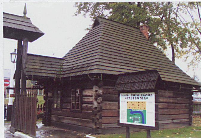
2. elewacja boczna, wschodnia