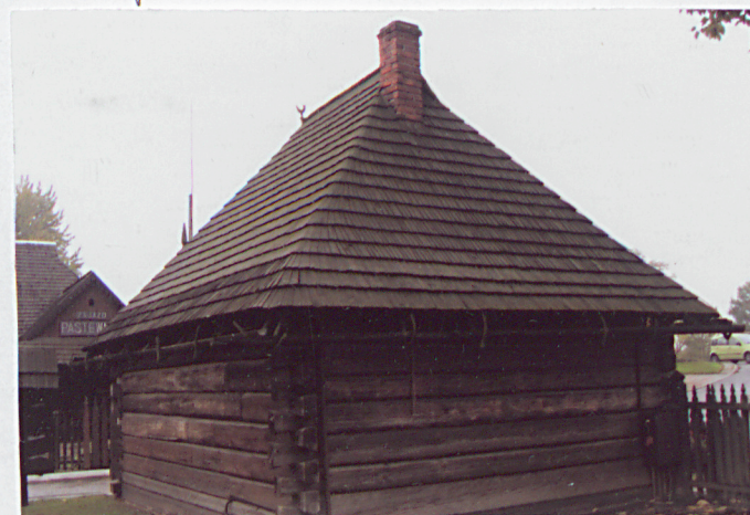
4. elewacja boczna - zachodnia

Wkładkę założył: październik 2009 r. R. T. Łamasz..... R.T. Łamasz