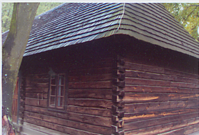
3. konstrukcja szkieletowa