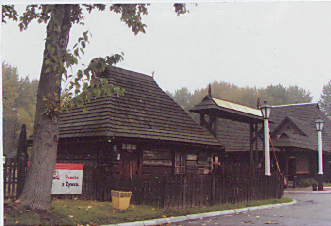
1. elewacja frontowa - południowa