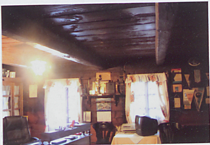
5. męskie izby