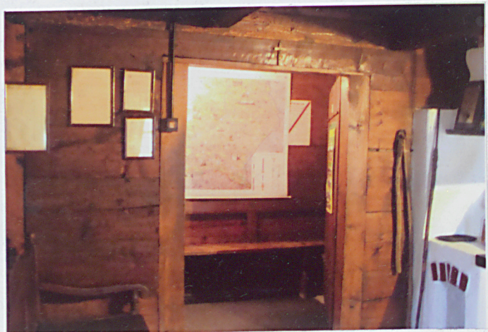
6. męskie z widokiem na śnie