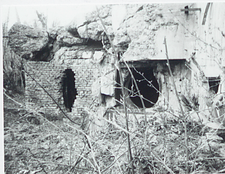
Betonowy schron bojowy artyleryjski w niezachowanym wale wschodniej cz. szańca