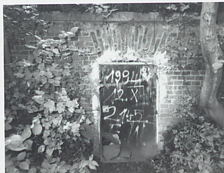
Ściana czołowa poprzecznicy z wejściem do schronu pogotowia

Wkładkę założył: mgr K. Szuwarowski, 10.1998r. K. Szuwarowski