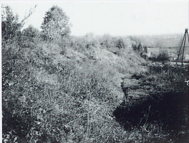
Fosa - Równia ogniowa, widok w kierunku wschodnim