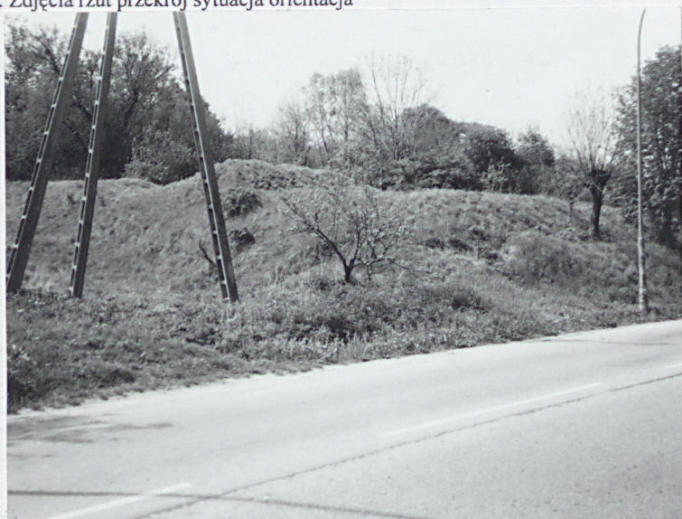
Widok ogólny szanca od strony południowej

11. Zdjęcia rzut przekrój sytuacja orientacja