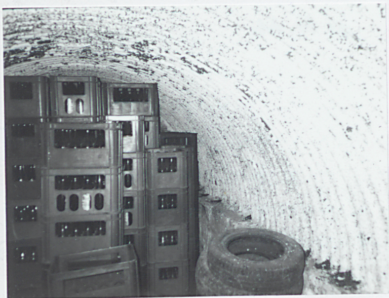
Wnętrze schronu pogotowia