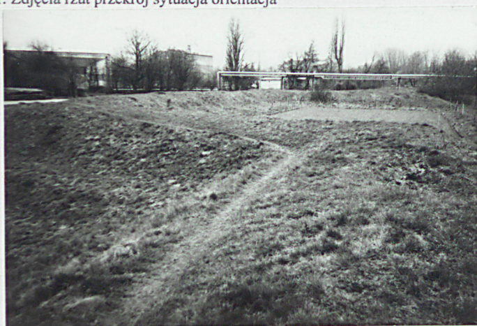
Widok ogólny szanca od strony wschodniej

11. Zdjęcia rzut przekrój sytuacja orientacja