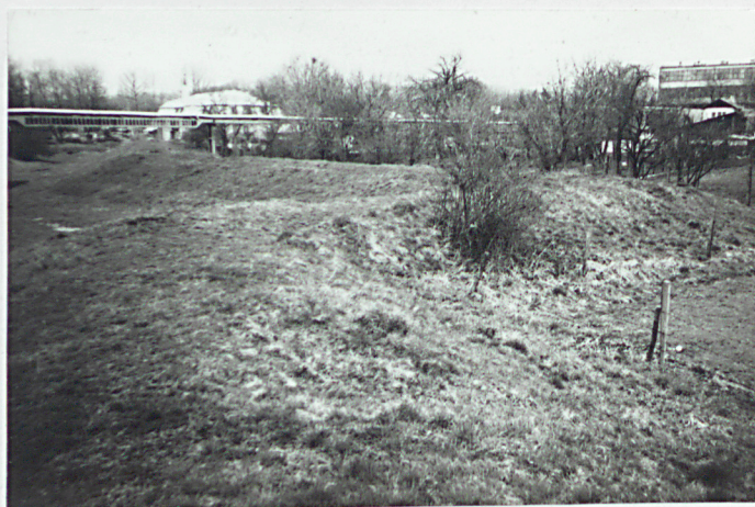
Widok czoła, prawego barku i kurtyny rdzenia