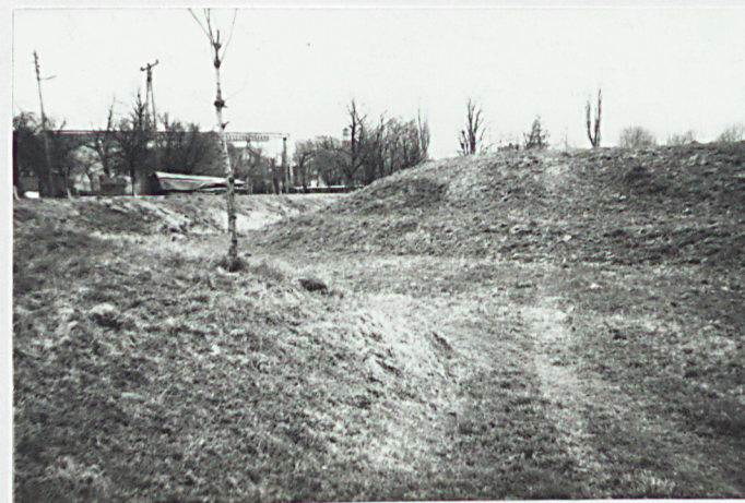
Fosa lewego barku i czoła szanca