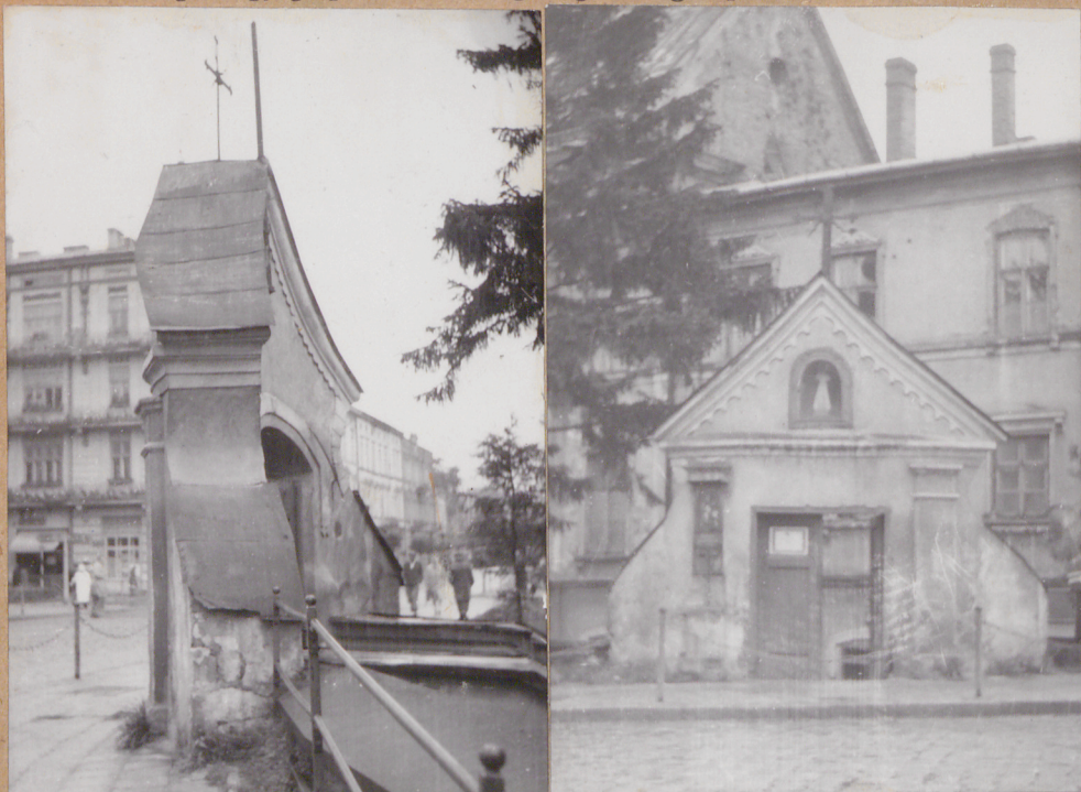
31. Szkic sytuacyjny, plan schematyczny, uwagi opisowe, fotografia